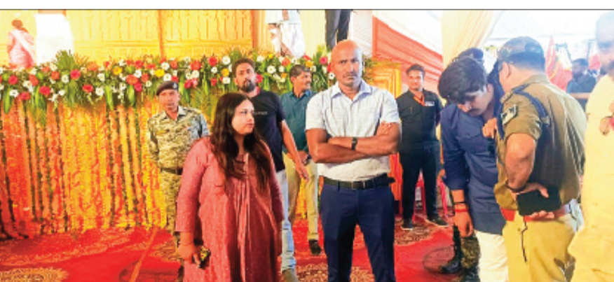
हरिभूमि न्यूज | सीहोर

कलेक्टर-एसपी ने कुबेरेश्वर धाम की व्यवस्थाओं का लिया जायजा