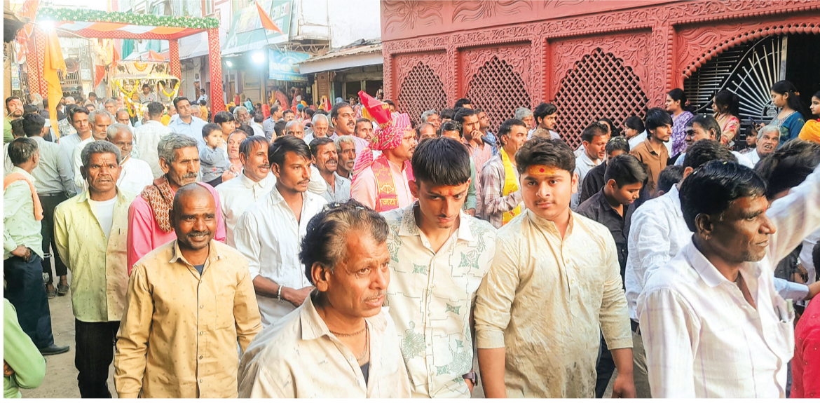
हरिभूमि न्यूज | नलखेड़ा

महाशिवरात्रि का पर्व नगर सहित अंचल के ग्रामों में हर्ष उल्लास के साथ मनाया गया। शिव मंदिरों में सुबह से ही भक्तों की भीड़ लगी रही। भक्तों ने भगवान भोलेनाथ की विशेष पूजा अर्चना कर रुद्राभिषेक भी किया। पूरे दिन नगर के शिवालय ओम नमः शिवाय के उच्चारण से गुंजायमान रहे। कई भक्तों ने इस दिन व्रत उपवास भी रखे।